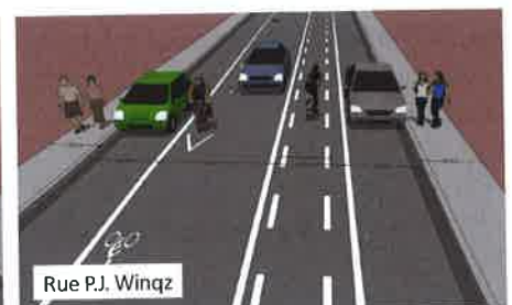
Rue P.J. Winqz

Pistes cyclables aménagées provisoirement