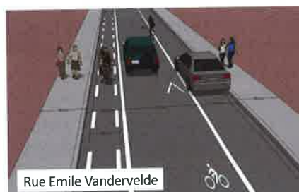
Rue Emile Vandervelde